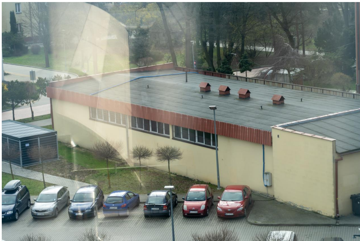
Ściana rzut z boku